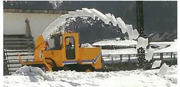
●高出力なエンジンによるダイナミックな除雪作業