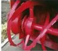
●油圧クラッチ式シャーペンレス装置仕様 (運転室内操作復帰型)

油圧クラッチ式シャーペンレス装置・スイングオーガ・180°スイングオーガ・油圧雪切・後輪ダブルタイヤ等、多彩なオプションが取付可能です。また、除雪装置は2.2m幅を標準としていますが、2.6m幅除雪装置に変更する事により、多雪地帯の拡幅除雪作業においても十分な能力を発揮します。