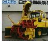
●180°スイングオーガ仕様